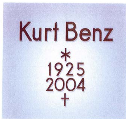
Schreibweise in Groß- und Kleinbuchstaben