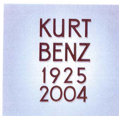
Schreibweise in Großbuchstaben