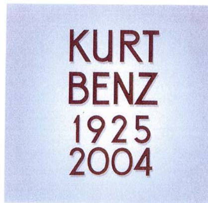
Schreibweise in Großbuchstaben